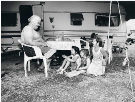
Eine jensische Grossmutter zusammen mit einer Kinderschar in den 1980er Jahren