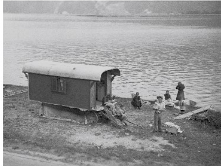
Eine jenesische Familie am Vierwaldstättersee bei Alpnachstad, aufgenommen 1944

Vor 50 Jahren kam einer der größten Skandale der Schweizer Sozialgeschichte ans Licht: Das vermeintliche Hilfswerk »Für die Kinder der Landstrasse« nahm mit staatlicher Unterstützung Hunderten Familien ihre Kinder weg. Weil sie Jenische waren VON WILLI WOTTRENG